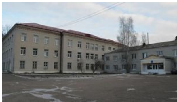
Клепиковская районная больница