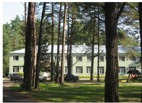
База отдыха «Мещера»