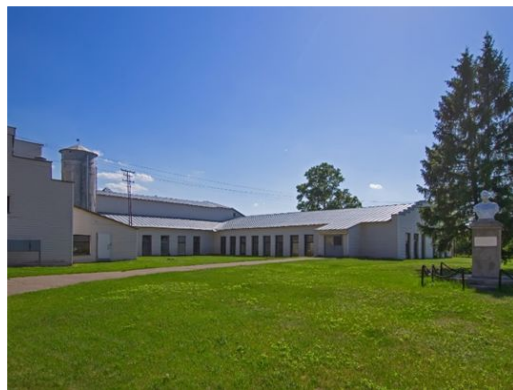
ООО «Емельянъ Савостинъ. Ватная фабрика»