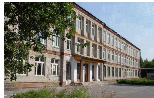
Клепиковская общеобразовательная школа