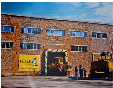
ООО «Питер Пит»