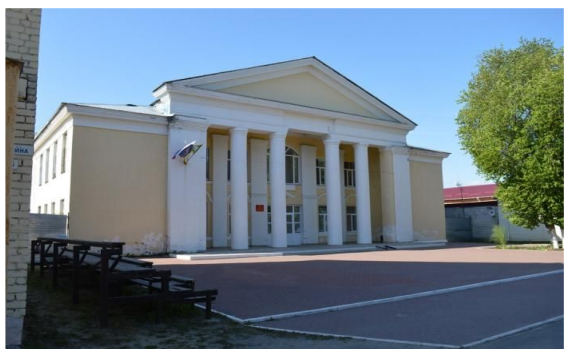
Районный Дом Культуры