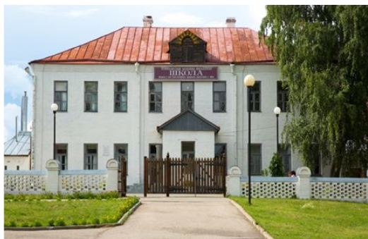
Музей-заповедник С.А. Есенина