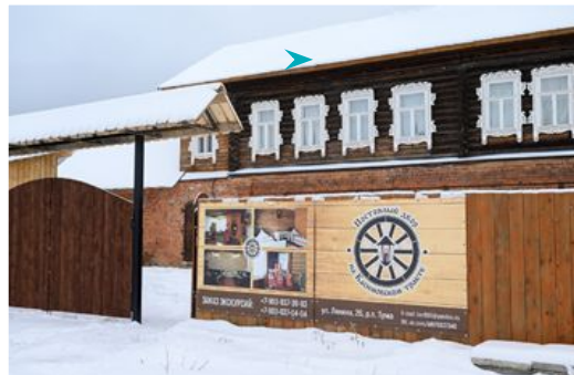
Музей «Постоялый двор на Касимовском тракте»