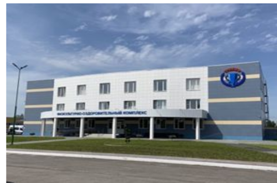
Физкультурно- оздоровительный комплекс