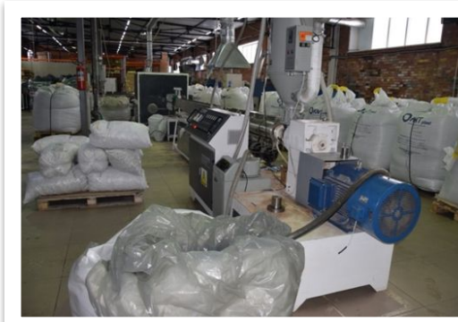
ООО «Лаборатория водоснабжения»