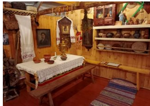
Дом-музей Тумского сказителя «Были-небыли»