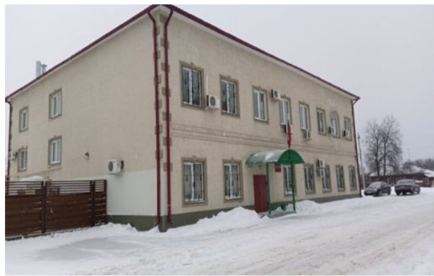
Клепиковский районный суд