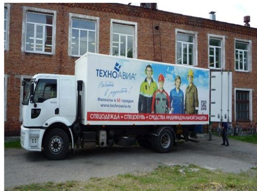
ОАО «Тумская швейная фабрика»