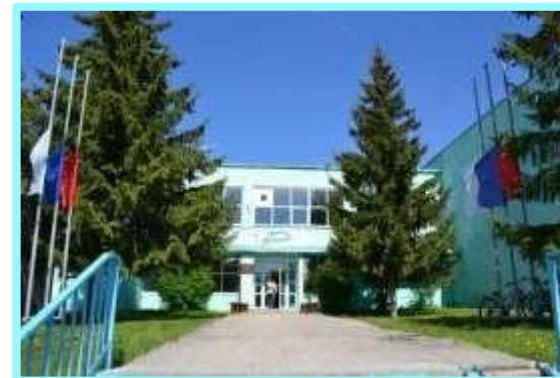
Спортивная школа Дельфин