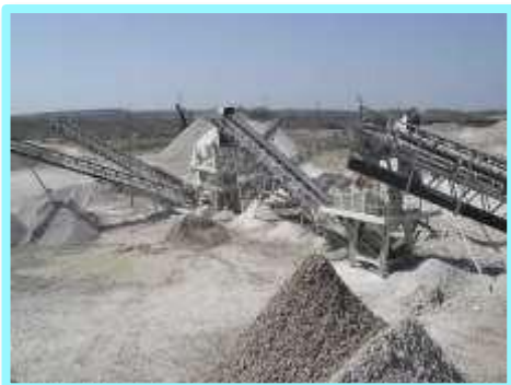
ООО «Пронские карьеры»