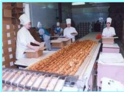
ОАО «Новомичуринский хлебозавод»