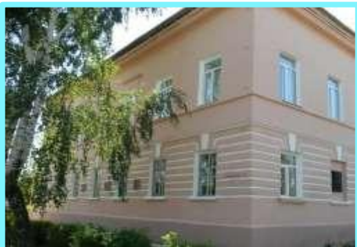
МУК Пронский краеведческий музей