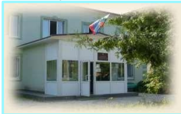
Пронский районный суд