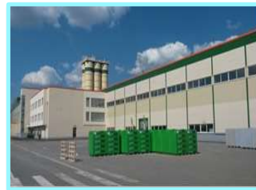
ООО «ЭКО- Золопродукт Рязань»