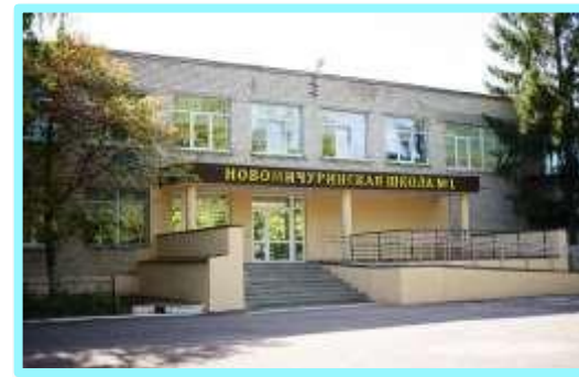
Новомичуринская общеобразовательная школа №1