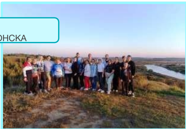
ПОКРОВКА –место силы древнего ПРОНСКА