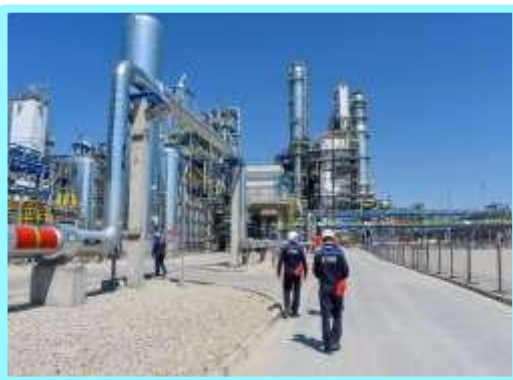
Новомичуринский филиал ООО «ГЭХ ТЭР»