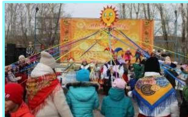
Народное гуляние «Масленица»