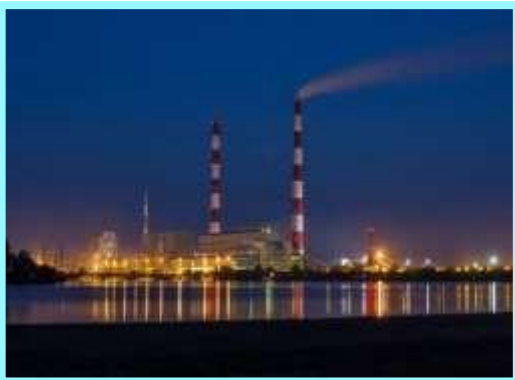
Филиал ПАО «ОГК-2» – Рязанская ГРЭС