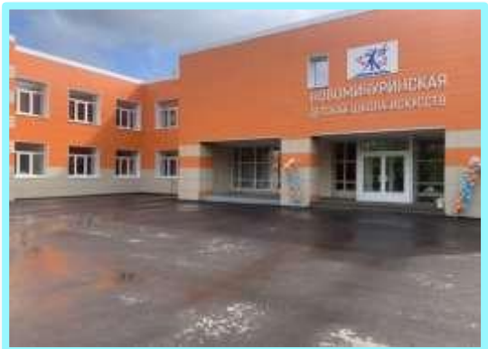
МБУДО Новомичуринская детская школа искусств