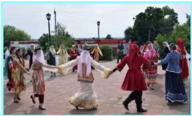
Фестиваль национальных культур «Вместе мы – Россия»