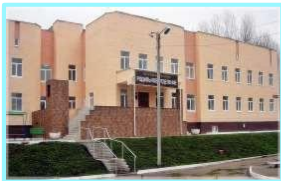
ГБУ РО Новомичуринская межрайонная больница