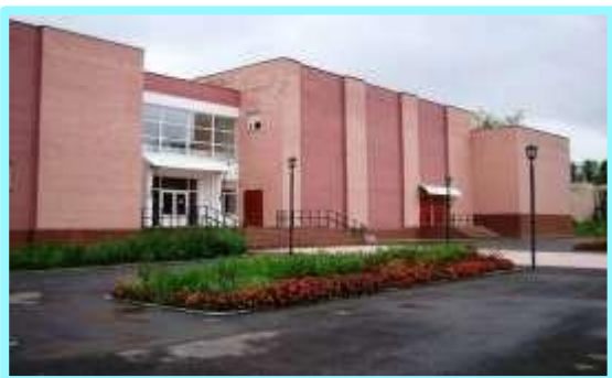
МУК Пронский районный Дом культуры