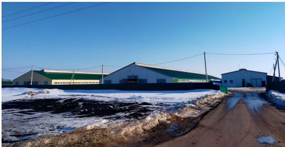
Молочно - товарная ферма ООО «Мир»