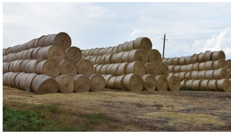
Заготовка кормов АО «имени генерала Скобелева»