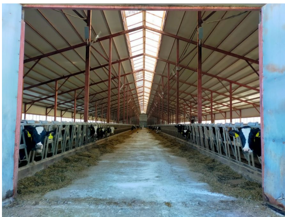
Молочно - товарная ферма ООО «Надежда»