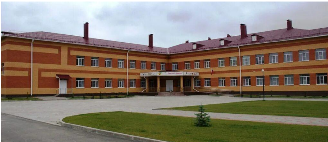
Начальный блок МБОУ Александро- Невской СОШ