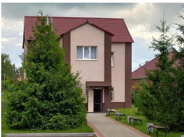
Музей- усадьба «Мемориальный комплекс М.Д.Скобелева» в р.п. Александро- Невский