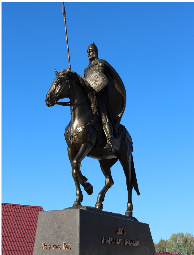
Памятник князю Александру Невскому