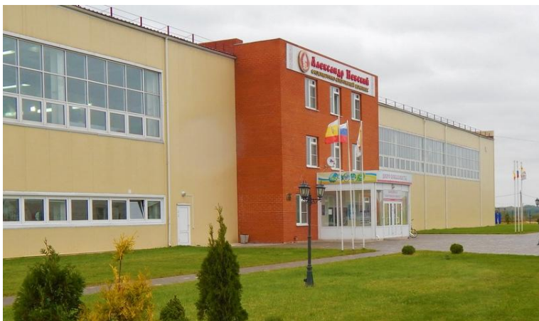
Спортивная школа «Александр Невский»