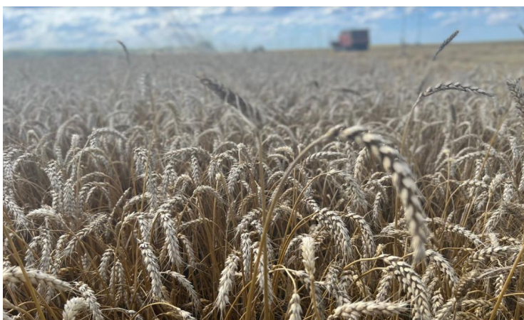
Производство зерновых ООО «Победа»