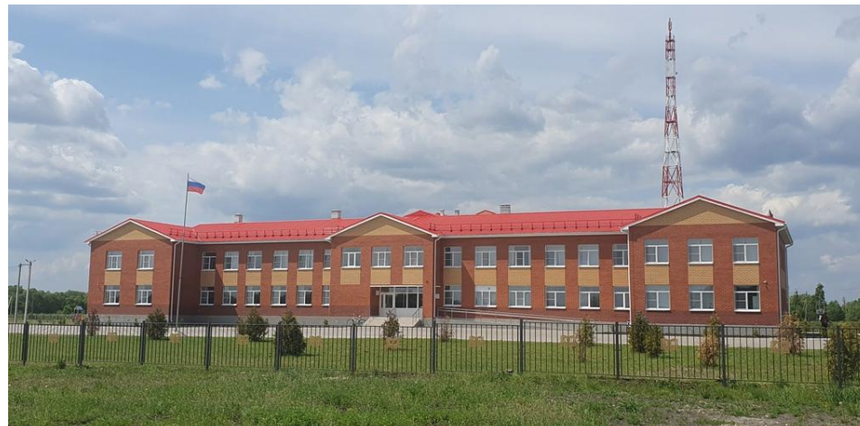
Просеченская СОШ им. генерала М.Д.Скобелева