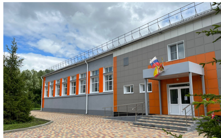
ДЮСШ им. генерала М.Д. Скобелева