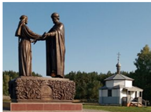
Памятник Петру и Февронии