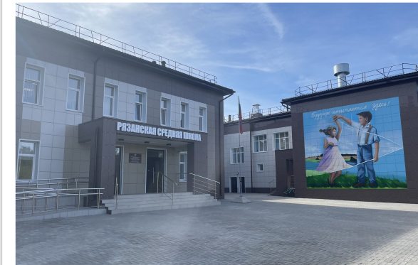
Рязанская средняя школа