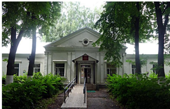
Рязанская районная больница