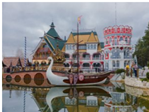
Развлекательный комплекс «В некотором царстве...»