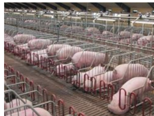
АО «Рязанский свинокомплекс»