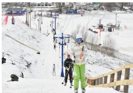
Спортивно-развлекательный комплекс Семено-Оленинский