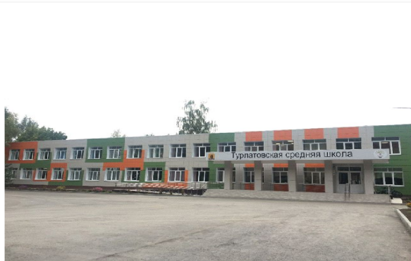
Турлатовская средняя школа