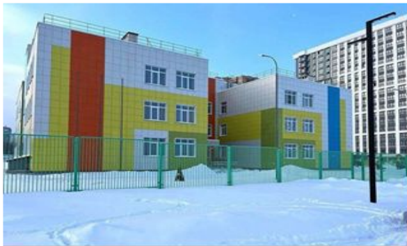
Дядьковский детский сад «Знайка»