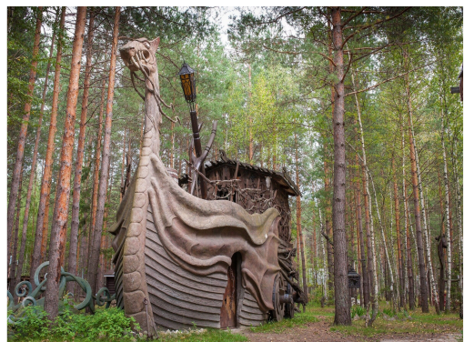
Музей деревянного зодчества Трубиных