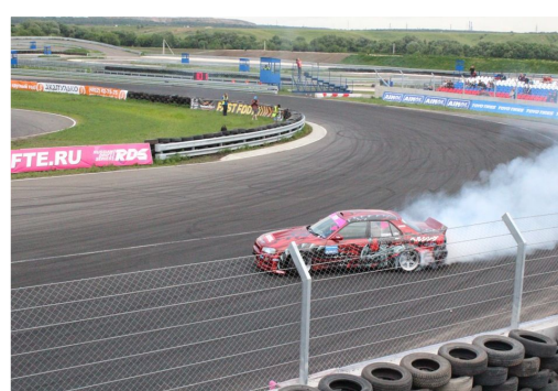
Автоспортивный комплекс «Атрон»