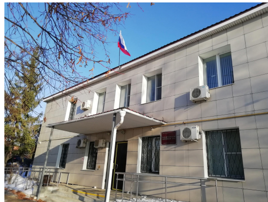
Михайловский районный суд