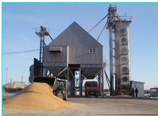
ООО «Малинки» ООО «Курсор»