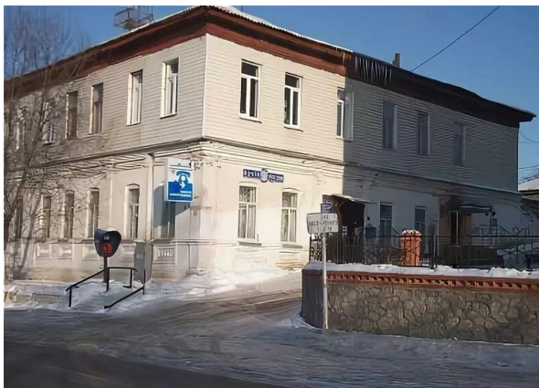
Отделение почтовой связи