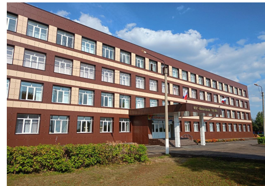
Михайловская общеобразовательная школа № 1