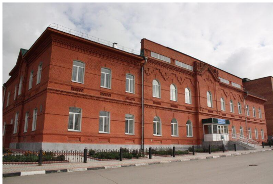
Михайловская районная больница