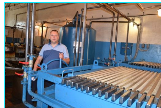
ООО «Сабуровский комбинат хлебопродуктов»