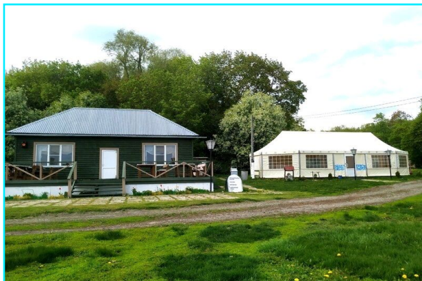
База отдыха «Бояринцево»