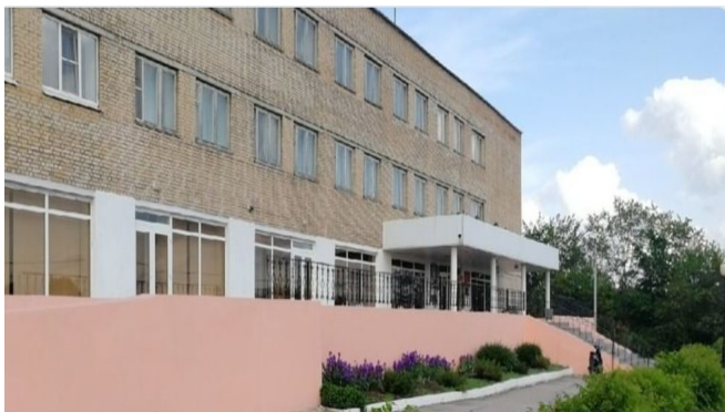
Районный Дом Культуры